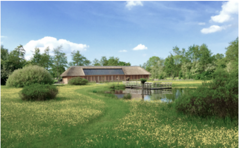
Het Curringherveld in volle bloei

In 1997 heeft Staatsbosbeheer een aantal percelen grasland in het voor natuur bestemde gebied ten zuiden van Kornhorn aangekocht. Vanwege de natuurbestemming waren de inwoners van Kornhorn toen ongerust dat het gebied niet meer vrij toegankelijk zou zijn en zijn in gesprek gegaan. Staatsbosbeheer heeft hen toen gevraagd om mee te denken over de inrichting van het gebied. De plannen daarvoor zijn verder uitgewerkt door de werkgroep Cultuur en Historisch Erfgoed Kornhorn waardoor zij daarna ook actief konden meewerken aan de ontwikkeling. Sindsdien is door tientallen vrijwilligers een groot aantal projecten gerealiseerd zoals de aanleg van wandelpaden en houtsingels en de bouw van een hooikiep. Ook een stuk heide is teruggebracht en er is een petgat gegraven met daaromheen de kenmerkende natte gronden. De geschiedenis van het landschap is zo in het Curringherveld zichtbaar gemaakt.